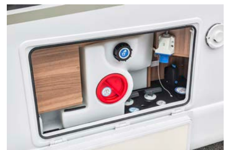
Leicht zugänglich: das Versorgungsmodul Ihrer Suite.