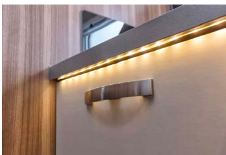
Very sweet: indirekte Beleuchtung unter der Arbeitsplatte.

* Sparvorteil gegenüber Einzelbezug bei vergleichbarem Serienmodell. | Alle Preise in Euro und inkl. 19% MwSt. ab Herstellerwerk WEINSBERG inkl. Fracht zum Händler, Gasprüfung, Fzg.-Brief und TÜV-Abnahme. | Alle weiteren Informationen unter: www.ic-weinsberg.de